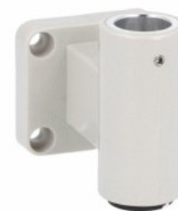
Kolumna sygnalizacyjna Ø50mm/1,97" LTN50