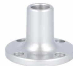
Kolumna sygnalizacyjna Ø50mm/1,97" LTN50