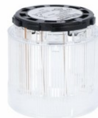
Kolumna sygnalizacyjna Ø70mm/2,75" 8TL7FL - Moduły światła błyskawicznego