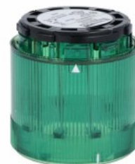
Kolumna sygnalizacyjna Ø70mm/2,75" 8TL7FL - Moduły światła błyskawicznego