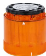
Kolumna sygnalizacyjna Ø70mm/2,75" 8TL7FL - Moduły światła błyskawicznego