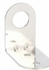
Colonne luminose Ø70 mm LTN70