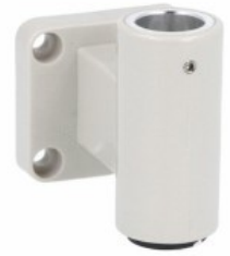
Colonne luminoase Ø50 mm LTN50