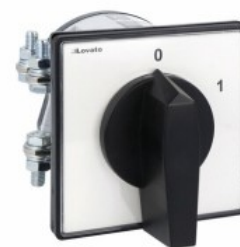
Comutatoare cu came rotative GN315