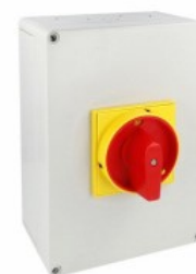
Comutator cu came in carcasă 7GN125