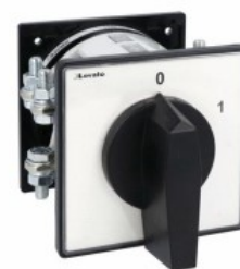
Łączniki krzywkowe GN200