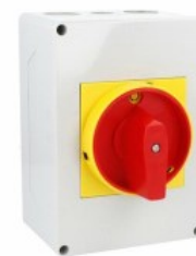
Łącznik krzywkowy w obudowie 7GN63