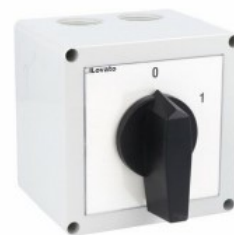
Łącznik krzywkowy w obudowie 7GN63