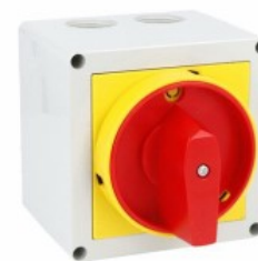
Łącznik krzywkowy w obudowie 7GN40