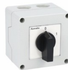
Łącznik krzywkowy w obudowie 7GN20