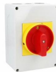
Commutatore a camme in cassetta 7GN63