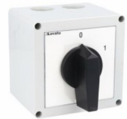
Commutatore a camme in cassetta 7GN63