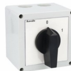
Commutatore a camme in cassetta 7GN40