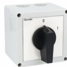
Commutatore a camme in cassetta 7GN32