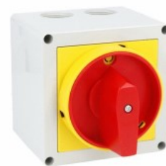
Commutatore a camme in cassetta 7GN32