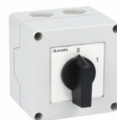
Commutatore a camme in cassetta 7GN20