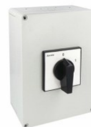
Commutatore a camme in cassetta 7GN125