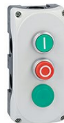
Stație de comandă gri LPZP3A8 completă cu buton verde de apăsare „I” LPCB1113 1NO, buton roșu prelungit „O” LPCB2104 1NC și lampă pilot verde 24V LPZP3B8911