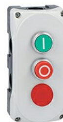
Stație de comandă gri LPZP3A8 completă cu buton verde de înclinat „I” LPCB1113 1NO, buton roșu prelungit „O” LPCB2104 1NC și pilot roșu 24V LPZP3B8901