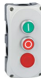
Stație de comandă gri LPZP2A8 completă cu buton verde de înclinat „I” LPCB1113 1NO, buton roșu de înclinat „O” LPCB1104 1NC și pilot roșu 24V LPZP3B8900