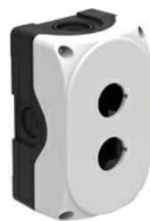
Stație de comandă din plastic fără actuatoare - pentru 2 actuatoare LPZP2A8