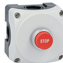
Stație de comandă gri LPZP1A8 completă cu buton roșu extins „stop” LPCB2134 1NC LPZP1B8105