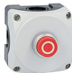
Stație de comandă gri LPZP1A8 completă cu butonul roșu extins „O” LPCB2104 1NC LPZP1B8104