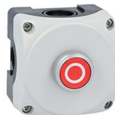
Stație de comandă gri LPZP1A8 completă cu buton roșu de apăsare „o” LPCB1104 1NC LPZP1B8102