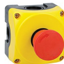
Stație de comandă galbenă LPZP1A5 completă cu buton ciupercă rotativ pentru eliberare LPCB6344 1NC LPZP1B5602