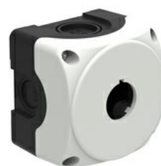
Stație de comandă din plastic fără actuatore - pentru 1 actuatore LPZP1A8