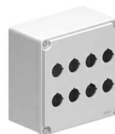
Statie de control pentru butoane cu orificii pentru operatori Ø22mm - 8 orificii LPZM