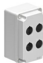
Statie de control pentru butoane cu orificii pentru operatori Ø22mm - 4 orificii LPZM