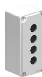
Statie de control pentru butoane cu orificii pentru operatori Ø22mm - 4 orificii LPZM