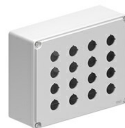
Statie de control pentru butoane cu orificii pentru operatori Ø22mm - 16 orificii LPZM