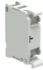
Elemente de testare pentru elemente LED cu lumină constantă LPXT