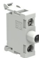
Elemente luminoase LED fixe pentru montare pe partea de jos a panourilor de intrare tip LPZ LPXLPB