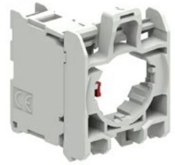
Elemente de contact - cu adaptor de montare LPXE