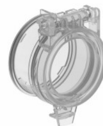
Capac de protecție pentru interfețe de comunicare Ø22mm/ 5 0,015 0,87" LPCD... LPXAU171