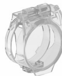
Capac de protecție pentru butoane Ø22mm/ 5 0,015 0,87" LPXAU170