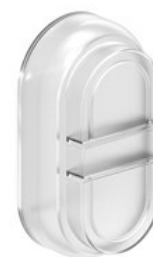
Capac de cauciuc (transparent) pentru nasturi dubli si tripli LPXAU157