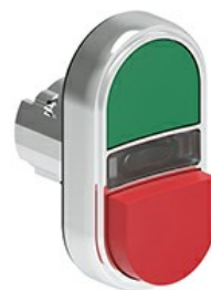
Buton cu dublă atingere, indicator alb cu retur cu arc - Un buton extins și unul înroscat LPSBL72