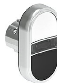
Buton cu dublă atingere, indicator alb cu retur cu arc - Două butoane de apăsare LPSBL71