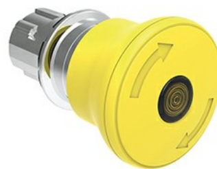
Buton iluminat în formă de ciupercă, cu zăvor rotativ și eliberare, Ø 40mm LPSBL66