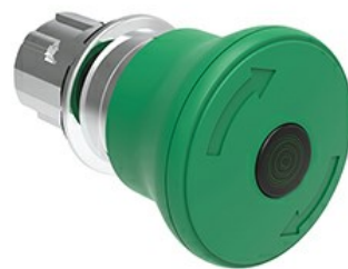
Buton iluminat în formă de ciupercă, cu zăvor rotativ și eliberare, Ø 40mm LPSBL66