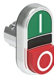
Buton cu dublă atingere, retur cu arc - Un buton extins și unul înroscat LPSB72