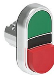
Buton cu dublă atingere, retur cu arc - Un buton extins și unul înroscat LPSB72