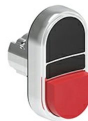
Buton cu dublă atingere, retur cu arc - Un buton extins și unul înroscat LPSB72