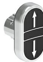
Buton cu dublă atingere, revenire cu arc - două butoane de apăsare LPSB71