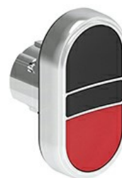
Buton cu dublă atingere, revenire cu arc - două butoane de apăsare LPSB71