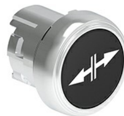
Butoane de impuls cu simboluri LPSB15